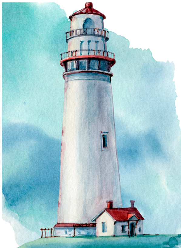
Rhifyn Hydref 2022